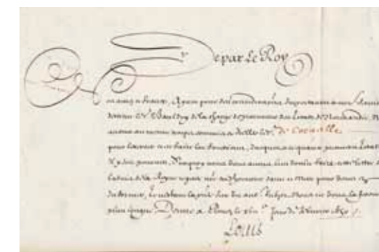
* Commission en faveur de Pierre Corneille, signée de Louis XIV et enregistrée par le Parlement