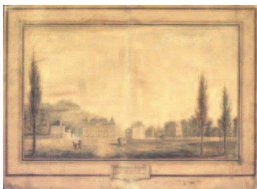
* Vue du Château de Cany, résidence de la famille Becdelièvre. ADSM 181Fi.