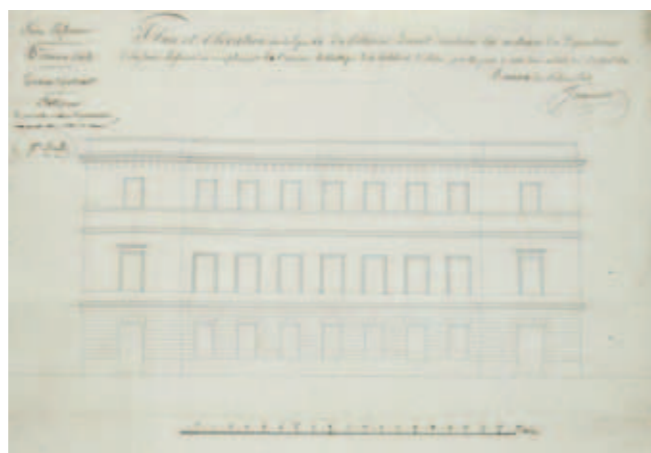
Élévation latérale et coupes du projet de bâtiment des Archives départementales, par Jouannin, 30 avril 1821. ; élévation longitudinale

abritant un escalier et de locaux de travail et d'accueil. Occupant une emprise de 30 mètres par 15, le bâtiment aurait offert moins de 3 500 mètres linéaires de rayon-