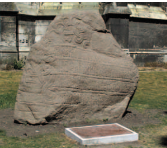
futhark récent ; Pierre de Saint-Ouen

titut Arne Magnusson de Copenhague, un manuscrit renfermant les lois de la province danoise de Scanie, composé vers 1300 entièrement en écriture runique. Cet exemple aujourd'hui unique d'utilisation de l'écriture runique dans la composition d'un manuscrit médiéval n'était peut-être pas isolé à l'époque. Les fouilles entreprises dans le quartier des quais à Bergen dans les années 50 ont permis de mettre au jour un ensemble très important de bâtonnets gravés de runes datant du XIII e siècle. La plupart des bâtonnets portent des mentions de propriété et servaient sans doute à identifier les marchandises échangées dans cette grande place de commerce à l'époque. D'autres messages prouvent que les runes étaient encore utilisées au XIII e siècle pour la communication courante, malgré la concurrence féroce de l'alphabet latin : un des bâtonnets porte en effet le message suivant : kya: sehir : atþu: kakhæim: que l'on peut traduire : Gyða te dit de rentrer à la maison ! ■