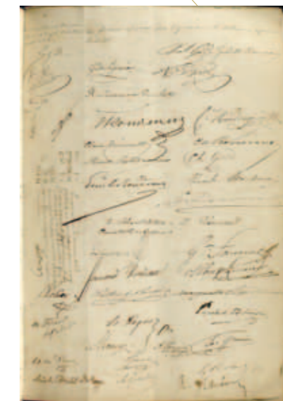
Signatures au bas du contrat de mariage de Paul Gide