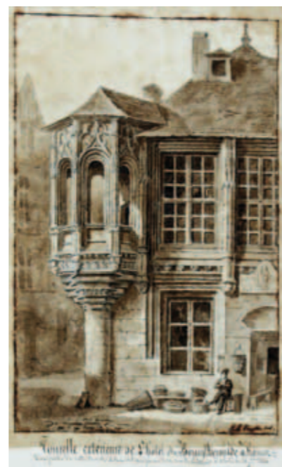
* représentation d'un ou deux des lieux évoqués : L'hôtel de Bourtheroulde avant 1824, dessin de Langlois. ADSM 6 Fi