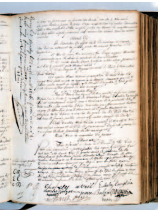
2 E 19 26 a

La numérisation des registres de tabellionage antérieurs à 1600 va être lancée au deuxième semestre. Cette opération, qui porte sur quelques 3000 registres et environ 1 500 000 vues, sera étalée sur plusieurs années et permettra d'assurer la sauvegarde de documents très consultés et d'une richesse historique et patrimoniale majeure. ■