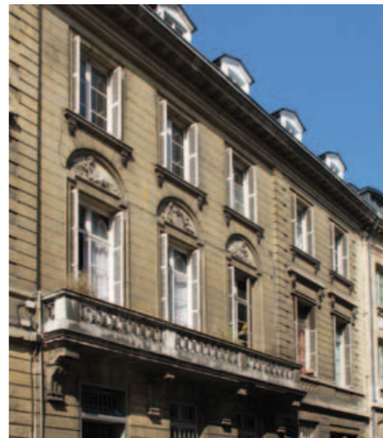
façade de l'hôtel de Bois-Guilbert