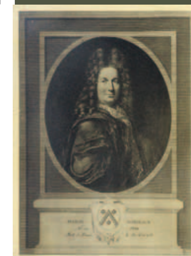
Jean-Marin Rondeaux de Sétry, portrait gravé

Si venant du Vieux-Marché, l'on remonte l'actuelle rue de Crosne jusqu'au croisement de la rue de Fontenelle, l'on remarquera, à hauteur de ce croisement, sur la droite, un immeuble à la belle ordonnance classique, aux fenêtres hautes et claires, surmontées de camées sculptées ; il fait l'angle des deux rues, il s'agit