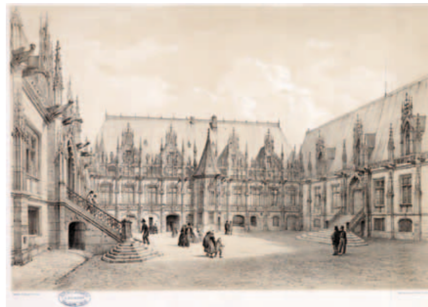
✿ Vue du Palais de justice au XIX e siècle. ADSM 74 Fi II]

Une exposition récente, organisée par la Cour d'appel, a marqué le 5 e centenaire de la construction du Palais de Justice, siège jusqu'à la Révolution du Parlement de Normandie. Héritier de l'Echiquier ducal, celui-ci était un des importants et plus anciens de France, après celui de Paris. Son lustre rejaillissait évidemment sur les magistrats qui y siégeaient.