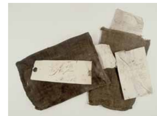
* Sacs de procès