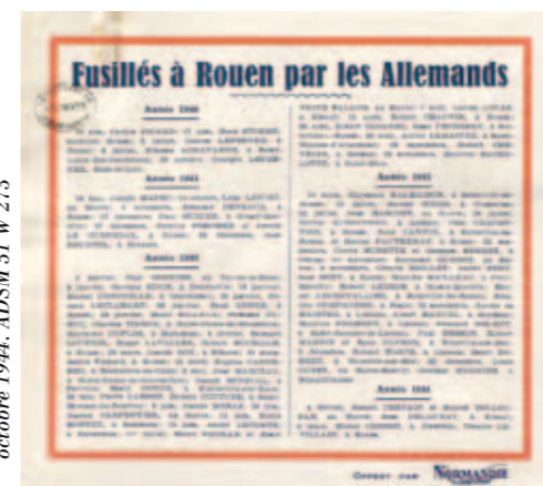
Tract du journal Normandie parle Français, octobre 1944.

J'habite près de Rouen, je suis élu local, et j'effectue l'essentiel de mes recherches dans le département. Il y a bien sûr les voyages à Paris, pour les archives, pour des colloques, comme le dernier auquel j'ai assisté, à la Fondation Jean Moulin sur le rôle des chrétiens à la Libération. Ma retraite est presque aussi active que ma vie professionnelle, mais je suis maître de mon temps et j'essaie de l'utiliser au mieux et en espérant apporter ma pierre à la connaissance de cette période dans notre département et pourquoi pas aider à rendre hommage à tous les résistants. ■