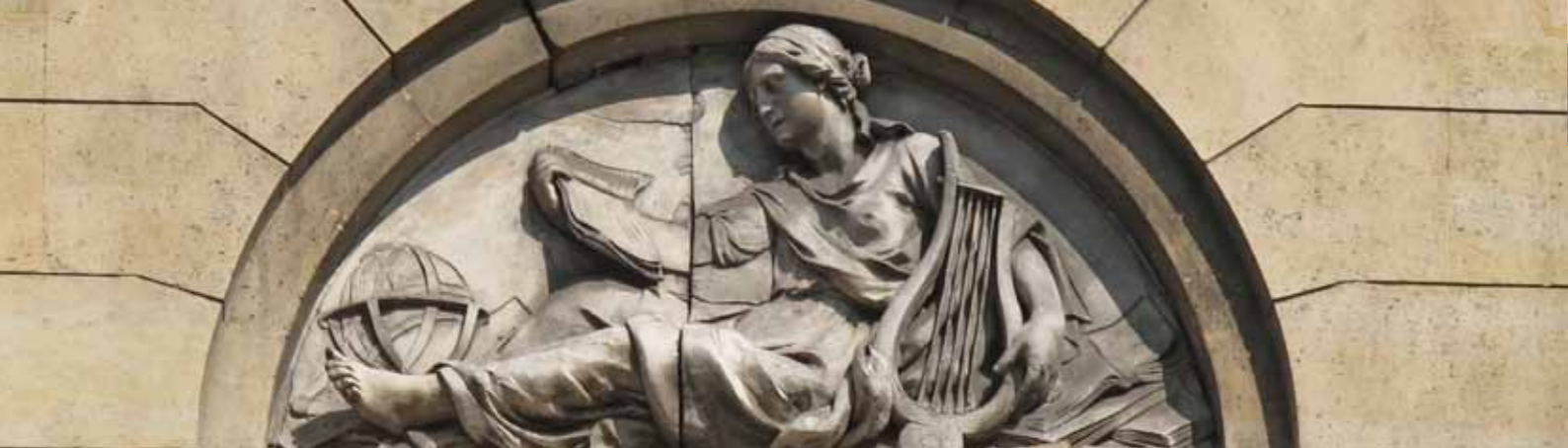
✿ Hôtel de Boisguilbert, bas-relief