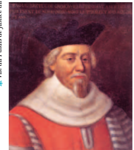
✿ Breton de Cremonville, président à mortier au Parlement

Il y a à cela plusieurs raisons : l'hérédité des offices d'abord, qui contribue à